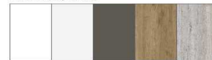
BLANCO WAX GRIS SARELA GRIS PARDO ROBLE GOLDEN ROBLE AMUNDSEN