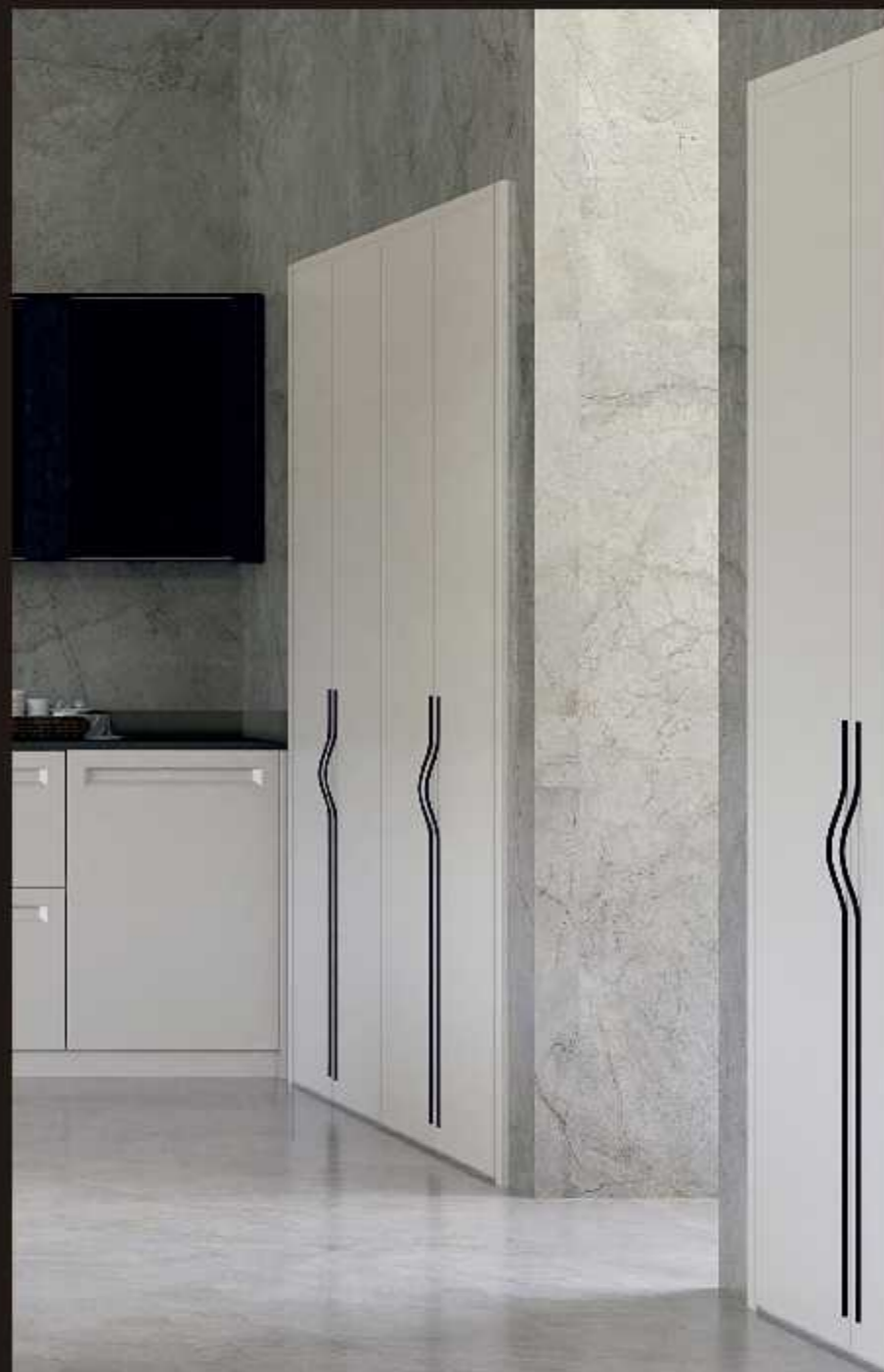
1. Cocina colección GLAMOUR , modelo TELMA acabado en AYURE MATE vitrinas modelo ETNA tirador BRAVE DESCENTRADO